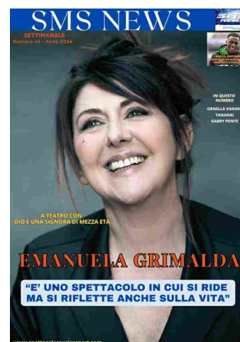
SMS NEWS NUMERO 45 ANNO 2024