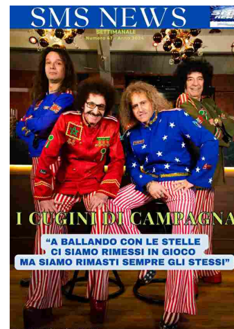
SMS NEWS NUMERO 47 ANNO 2024