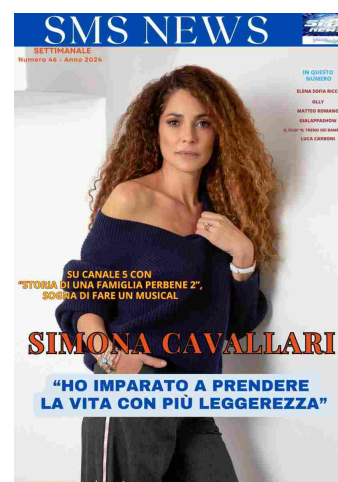
SMS NEWS NUMERO 46 ANNO 2024