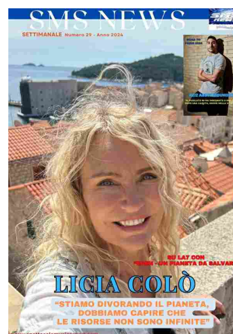
SMS NEWS NUMERO 29 ANNO 2024