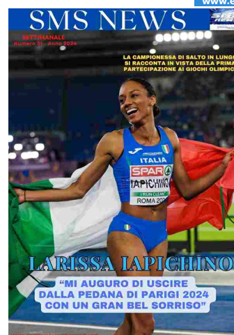
SMS NEWS NUMERO 31 ANNO 2024

"Quando grandi personalità provenienti da mondi anche distanti, con punti d'osservazione unici, conoscenze, esperienze e storie diverse si incontrano, le intuizioni si trasformano in idee, si materializza l'inaspettato e si aprono nuovi orizzonti possibili. È quello che ogni anno succede a Camogli, è il modo con cui il Festival della Comunicazione guarda al futuro e alimenta le speranze", racconta il direttore del Festival Danco Singer. "In un momento storico in cui, dai luoghi più distanti a quelli più prossimi, aumentano i motivi di preoccupazione, il nostro modo di offrire speranza passa attraverso la cultura in tutte le sue forme, attraverso il dialogo, il confronto e la riflessione, per una festa della cultura che guardi al futuro con