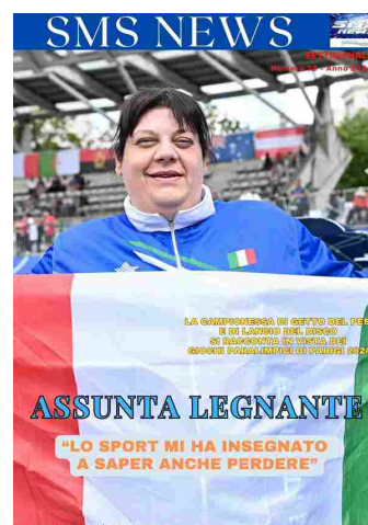
SMS NEWS NUMERO 30 ANNO 2024