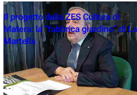
Il progetto della ZES Cultura di Matera: la "fabbrica giardino" di La Martella