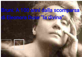
Bruni: A 100 anni dalla scomparsa di Eleonora Duse "la divina"