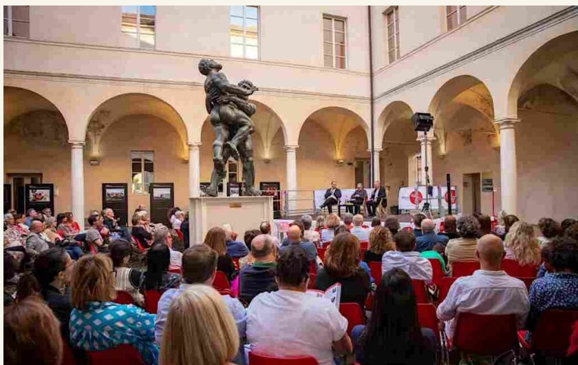
Il Cortile d'Onore della Casa della Musica

Saranno tre giorni che metteranno al primo posto i giovani con le loro speranze, attese e paure, con quella "Nostalgia del futuro" , insomma, che è farà da fil rouge agli oltre 60 eventi in programma nella città ducale: incontri, presentazioni di libri, laboratori, spettacoli, concerti, mostre e attività creative ed esperienziali per grandi e piccoli che faranno di Parma un luogo speciale di socialità, convivialità e cultura.