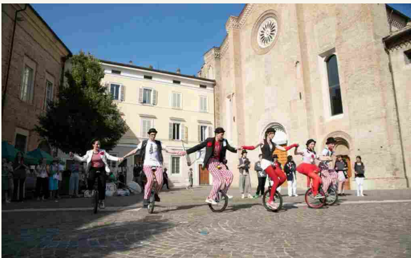
Piazzale San Francesco del Prato

Interessanti anche i laboratori che il Festival propone a un pubblico di tutte le età, dislocati come gli altri appuntamenti nei più diversi luoghi della città, dal Chiostro San Francesco alla Sala Biblioteca Casa della Musica, dal borgo delle Colonne allo stesso piazzale San Francesco. Tantissimi i temi: dalla luce al disegno, dai cercatori di bellezza, alla paura della fantasia, alla nostalgia della natura e il potere curativo delle piante. Non mancheranno infine anche performance di scrittura e pittura dal vivo , il mercato degli artigiani e uno speciale street food con prodotti a filiera corta, biologici, basso impatto ambientale e con menù per tutti i gusti.