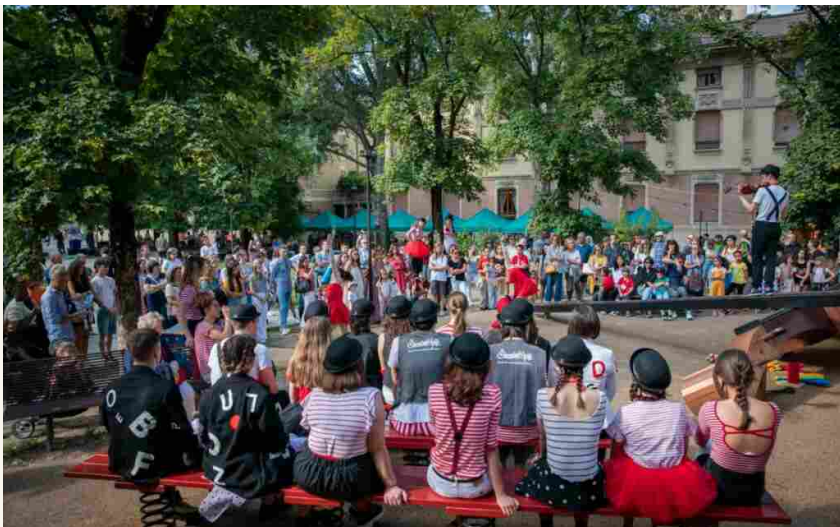
Piazzale Salvo D'Acquisto

Interessanti anche i laboratori che il Festival propone a un pubblico di tutte le età, dislocati come gli altri appuntamenti nei più diversi luoghi della città, dal Chiostro San Francesco alla Sala Biblioteca Casa della Musica, dal borgo delle Colonne allo stesso piazzale San Francesco. Tantissimi i temi: dalla luce al disegno, dai cercatori di bellezza, alla paura della fantasia, alla nostalgia della natura e il potere curativo delle piante. Non mancheranno infine anche performance di scrittura e pittura dal vivo , il mercato degli artigiani e uno speciale street food con prodotti a filiera corta, biologici, basso impatto ambientale e con menù per tutti i gusti.