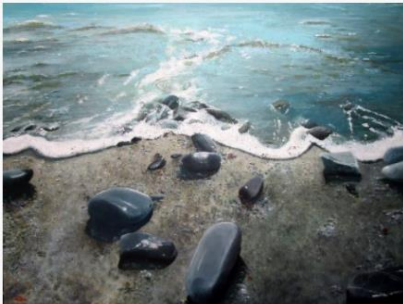
Tutto può succedere – Alberto Perini Sea

La seconda si intitola “Fotografando il Festival”, a cura di Roberto Cotroneo, affezionato compagno di viaggio del festival, in programma fino al 10 settembre. Per le vie di Camogli saranno esposti scatti selezionati dallo scrittore, che fin dal primo anno ha portato con sé una macchina fotografica per documentare e conservare ciò che accadeva, come dei veri e propri appunti personali. Su suggerimento dei direttori del festival, Cotroneo ha scelto delle immagini che comunicano, attraverso la loro immediatezza, pensieri e atmosfere che hanno caratterizzato la manifestazione e che raccontano anni di incontri, persone e amici. Degli oltre 300 ospiti che nelle scorse tre edizioni hanno animato la città di Camogli, in mostra ritratti di volti cari al festival come Umberto Eco, Paolo Fabbri e Furio Colombo, solo per citarne alcuni.