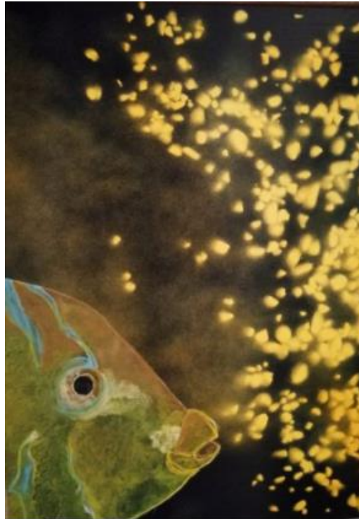
Oro – Catlo Rognoni